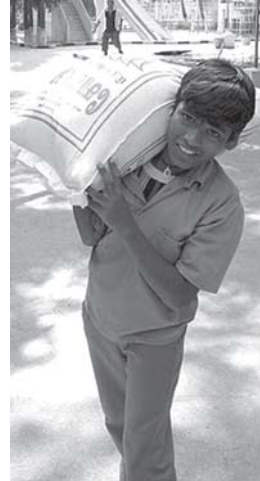
ಮೃತರ ಫಿರಿಯಾಕ್ಕೆ ಬದಲಿ

ಉಪವಾಸದ ಫಿರಿಯಾ ಒಂದು ಉಪವಾಸಕ್ಕೆ ಒಂದು ಮುದ್ದು ಊರಿನ ಹೆಚ್ಚಿನ ಬಳಕೆಯ ಆಹಾರಧಾನ್ಯ. ಒಂದು ಮುದ್ದು ಅಕ್ಕಿ ಸುಮಾರು 650ಗ್ರಾಂಗಳಿರುತ್ತವೆ.